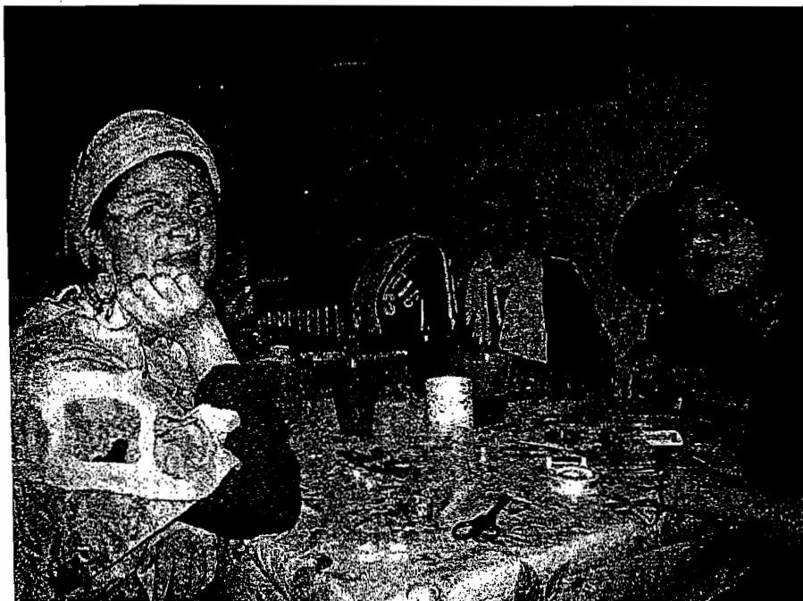
Hygge i Peaches med øreringe-værksted.