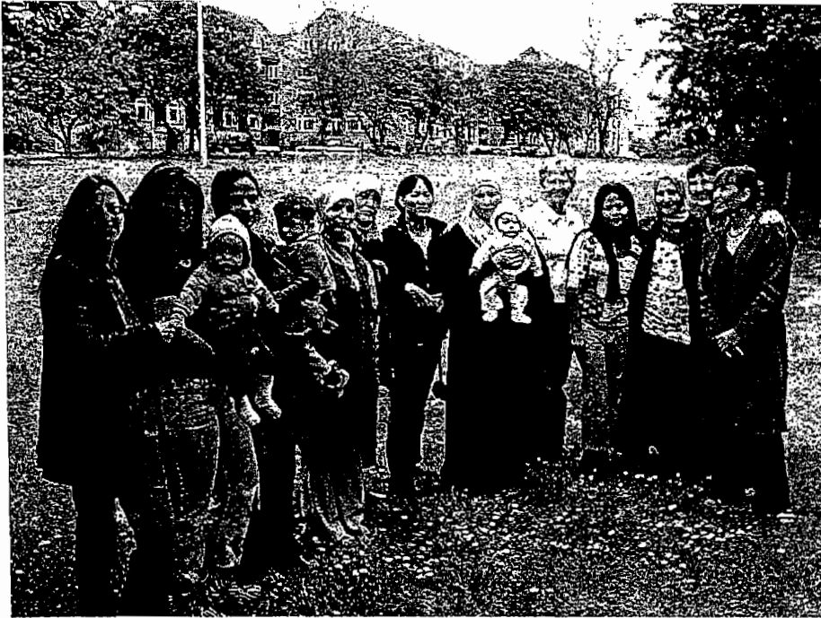
Kvinder, børn og ansatte under fotoprojektet

Kringlebakkens kursusgruppe består af mellem 10-15 18 til 30årige indvandrer- og flygtningekvinder med små børn mellem 0 til 3 år. Nogle er selvforsørgende og andre er på kontanthjælp eller dagpenge. Kvinderne er enten hjemmegående, på barselsorlov eller i aktivperioden. En mere detaljeret beskrivelse af målgruppen kan læses i vores projektbeskrivelse.