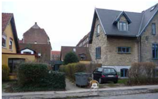
Villaer med udstykning i koteletgrunde.

Den midterste del af lokalplanområdet vist med gul indramning. Her er der en blanding af villaer og etagebebyggelse. Mod vest ligger der villaer og mod øst etagehuse.