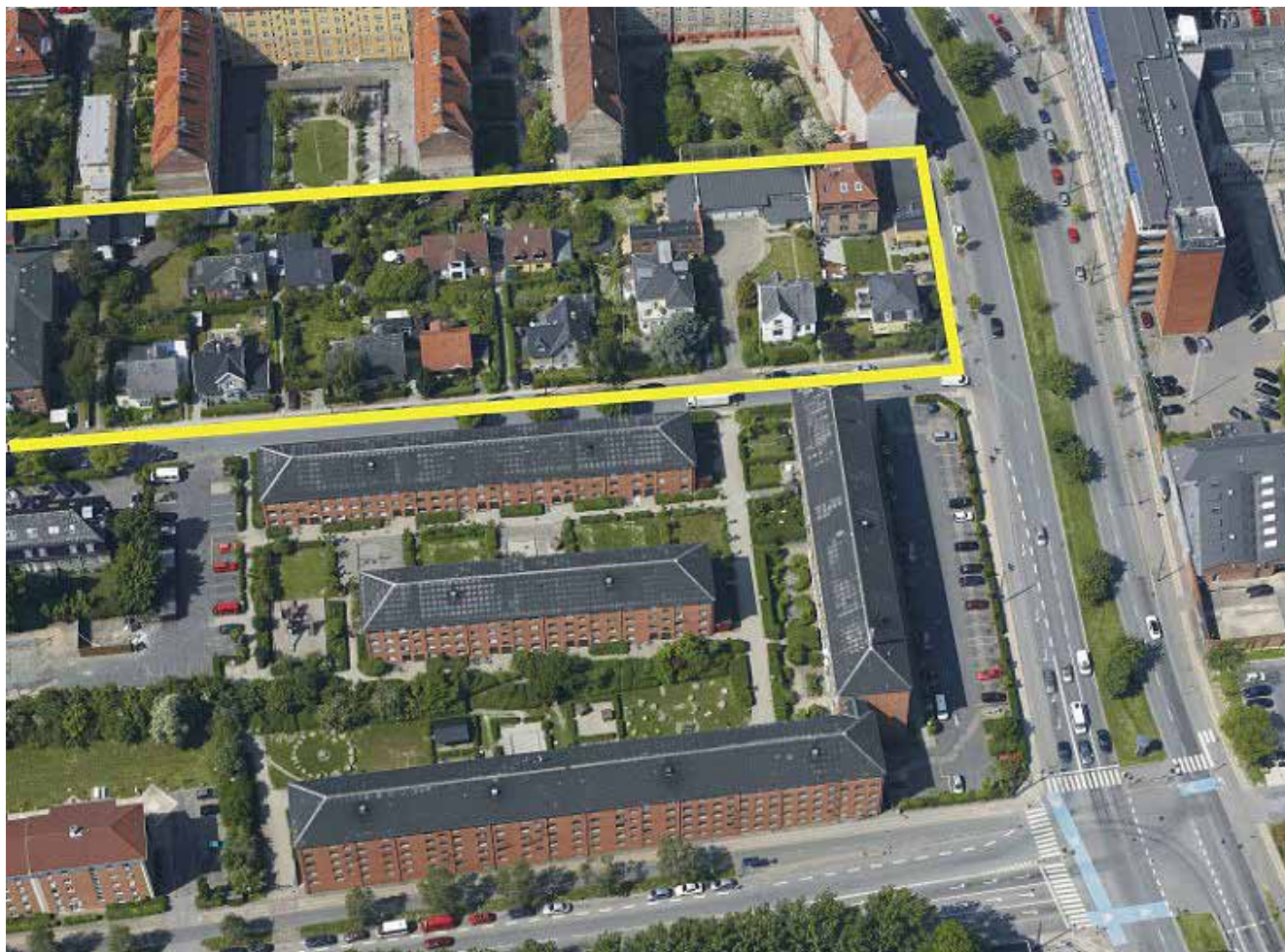
Den nordlige del af lokalplanområdet vist med gul indramning. Denne del er præget af villabebyggelse omgivet af etageboliger. Mod nord grænser området til Vigerslev Allé.