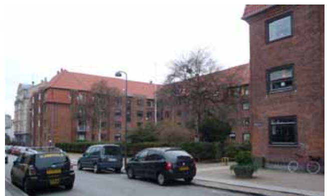
Valbygårdsvej set mod syd.

En række tiltag kan medvirke til at opfylde dette krav for eksempel ved at udnytte regnvandet til rekreative formål, grønne tage, vanding, nedsivning/forsinkelse gennem permeable belægninger etc.