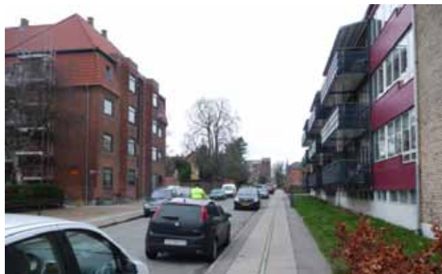
Valbygårdsvej set mod nord.

Valbygårdsvej har i dag overvejende en bredde på ca. 11,6 m. Den nuværende vejudvidelseslinje svarende til en bredde på 18,83 m (30 alen) fastholdes som bebyggelsesregulerende byggelinje. Der fastlægges en ny vejudvidelseslinje svarende til en fremtidig bredde på 15 m således, at vejen kan få 2,5 m fortove, langsgående parkering i begge sider kombineret med træer samt 6 m kørebane. Vejtræerne vil medvirke til at øge områdets grønne præg.