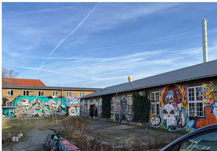
Eksempler på street-art på bygningernes facader.