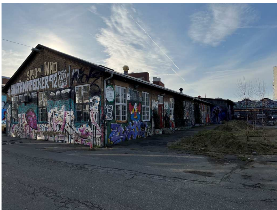
Bygning III – Den nordligst placerede af de oprindelige tværliggende bygninger.

Samlet bevaringsværdi: Bygningen vurderes til at være bevaringsværdig som en tidstypisk brugsbygning, der er en del af et harmonisk bymiljø, og som med sine særlige funktioner er en del af kommunens historie. Bygningen er registreret med en middel SAVE-værdi på 6.