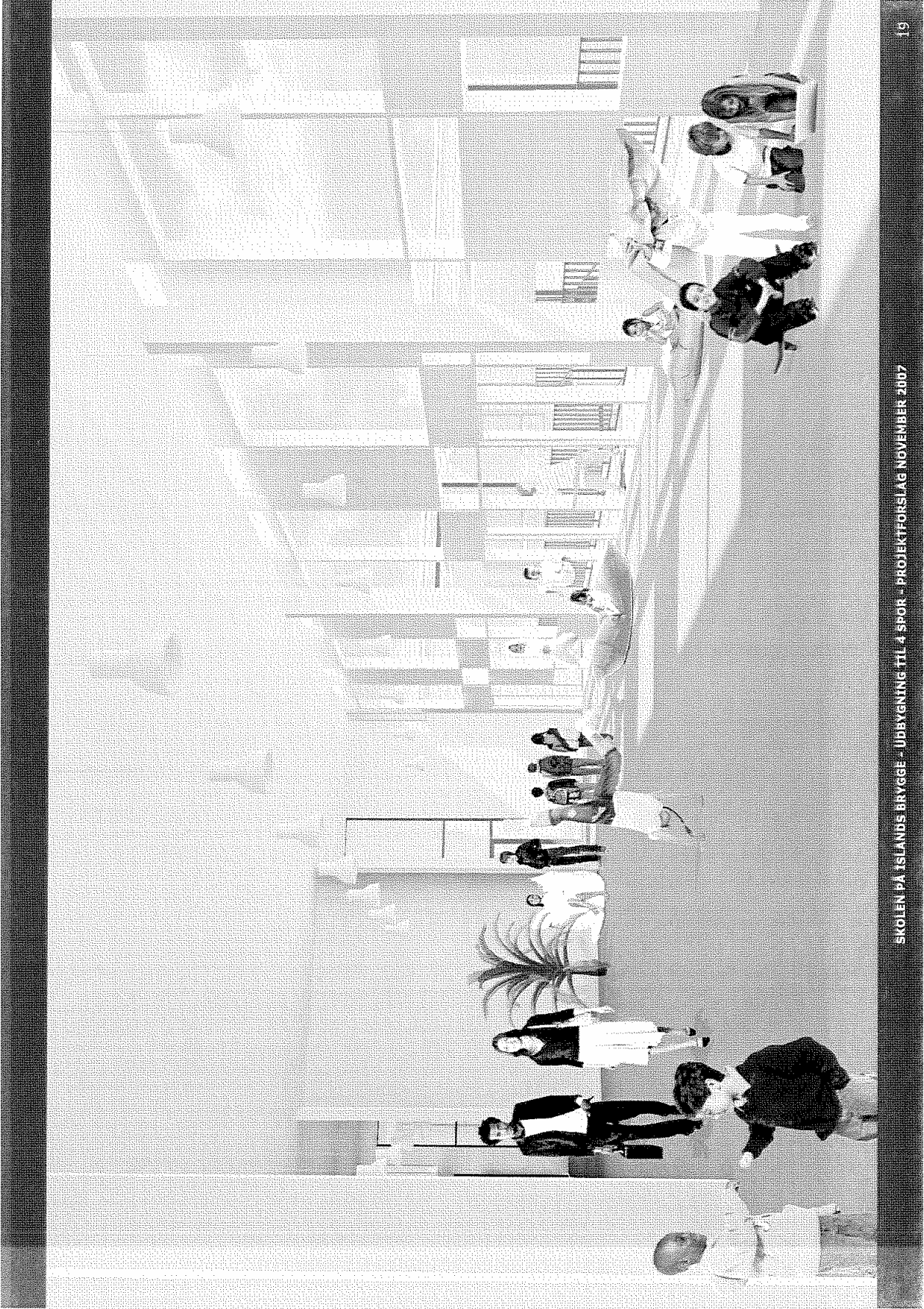
SKOLEN PÁ ISLANDS BRYGGJE - ÚBBYGNING TIL 4 SPOR - PROJEKTFORSLAG NOVEMBER 2007