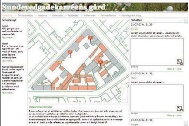
Ex på hjemmeside, her Sundevedsgade-karreem

Gårdrumsspillet vil have til huse på en hjemmeside oprettet specifikt for denne karré. Her kan borgerne få informationer og debattere vedr. anlæggelsen af det nye gårdanlæg. Via et brugervenligt, interaktivt 3d-værktøj har borgerne endvidere mulighed for at komme med forslag til det kommende gårdanlæg samt opleve, hvordan det vil komme til at se ud i 3 dimensioner. På alle tidspunkter i processen kan beboerne debattere egne og andres forslag og synspunkter - med mulighed for bidrag fra eksempelvis landskabsarkitekt og øvrige eksterne parter.