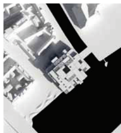
21. marts kl. 9.00 - Efter