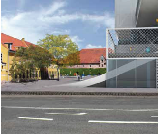
Nedenfor ses bypladsen fra Vester Voldgade som i lokalplanforslaget og efter flytning af bebyggelsen 5 m mod havnen. Nederst ses bypladsen fra Søren Kirkegårds Plads efter flytning af bebyggelsen. Udsynet til Chr. IV's Bryghus og Fæstningens Materialegård er væsentligt forbedret.