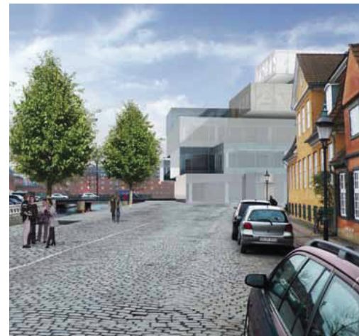
Til venstre ses kigget langs Frederiksholms Kanal mod havnen som i lokalplanforslaget og til højre ses kigget efter tilbagevinding af stueetagen og aftrapping af bebyggelsens hjørneprofil. Ved bygningshjørnet tættest på Materialegården er promenadebredden øget fra ca. 6 til ca. 11 m, og længst mod havnen er bredden øget fra 5 til 6,5 m.