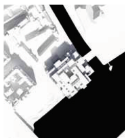
21. marts kl. 11.30 - Efter

Efter bebyggelsens flytning kan ses en forbedring af solforholdene på bypladsen om formiddagen