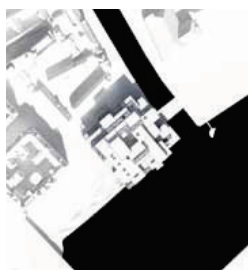
21. marts kl. 11.30 - Før