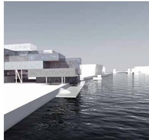
Til venstre ses bebyggelsens front og passage langs havnen som i lokalplanforslaget og til højre efter bebyggelsens flytning og justering af facader og havnepassage. I baggrunden skimtes Knippels Bro. Havnepassagens bredde udfor stueetagens udkræning er øget fra 3 til 5 m. Resten af passagen er ca. 9 m bred. Passagens afgrænsning langs havnen flugter med den udkragede facade fra 1. sal og opefter.

Der er ingen ændringer i forslag til kommuneplantillæg.