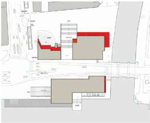
Den røde signatur viser stueetagens udstrækning i lokalplanforslaget. Den grå signatur viser stueetagens udstrækning efter flytning af bebyggelsen og tilbagevinding af stueetagen mod kanalen.