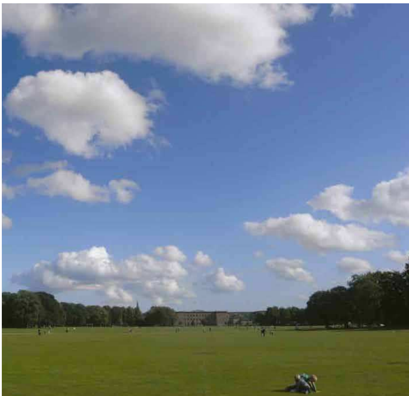
Fælledparken gennemgår i disse om en omfattende renovering for 150 mio. kr..