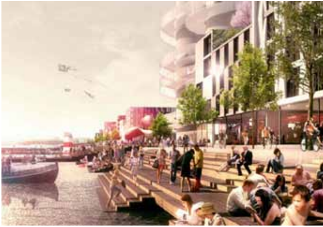
Visualisering af Cobes vinderforslag for Nordhavn