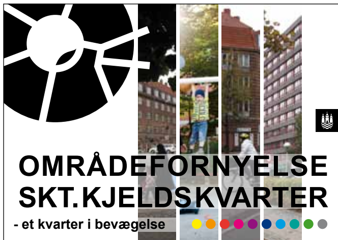
Investeringsredegørelsen for det nordlige Østerbro skal ses i sammenhæng med Områdefornyelsen for Skt. Kjelds Kvarter.