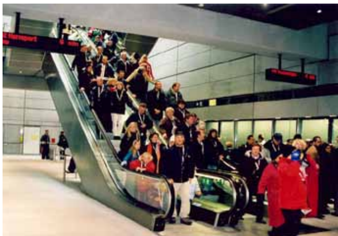
Der er i dag xx mio. passagerer årligt i Metroen - det forventes at stige til xx mio. med de nye Cityring.