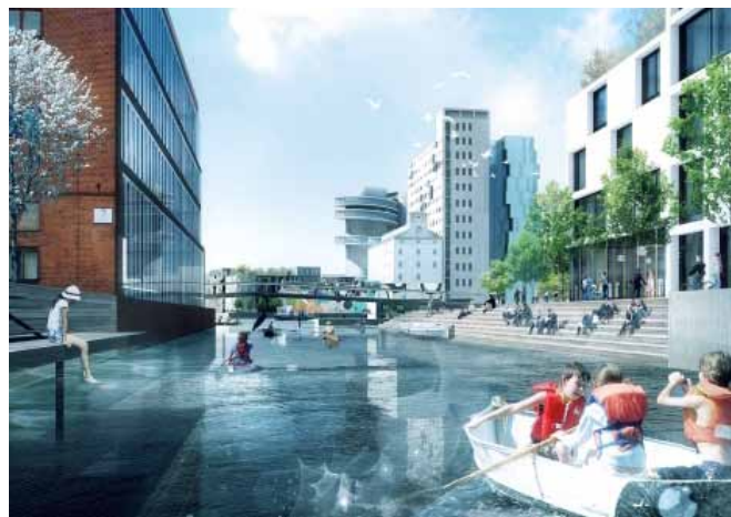
Visualisering af Cobes vinderforslag for Nordhavn