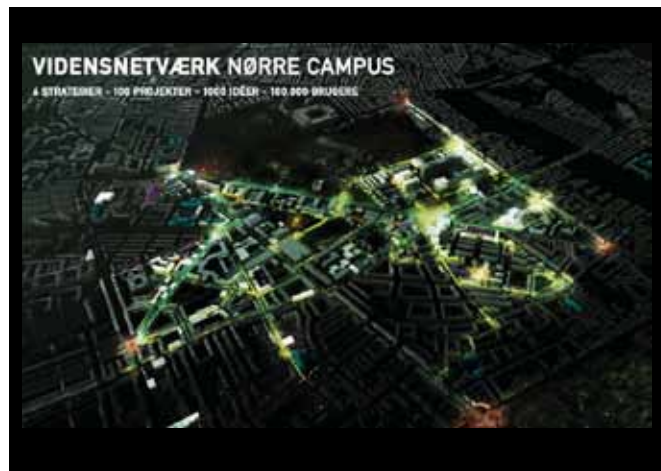
Cobes visualisering af visionsplanen for udviklingen af Nørre Campus.