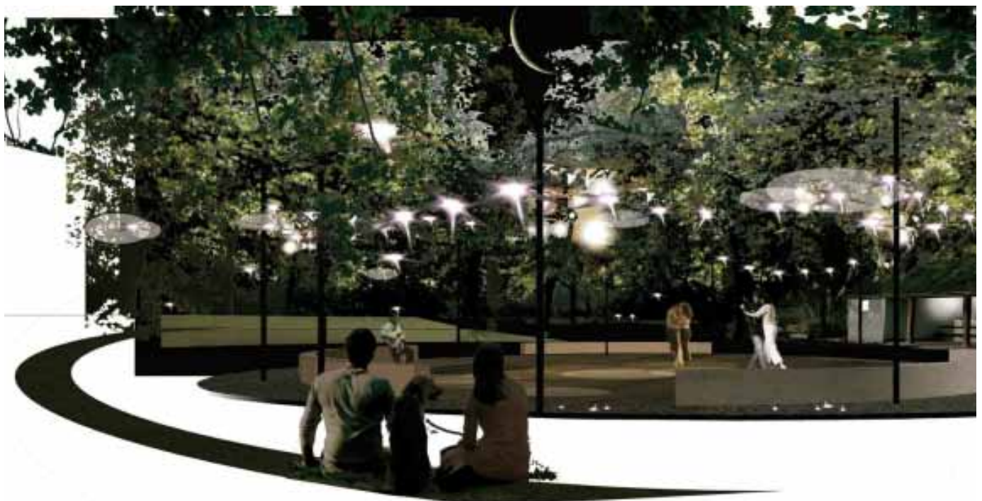
Fælledparken gennemgår i disse om en omfattende renovering for 150 mio. kr..