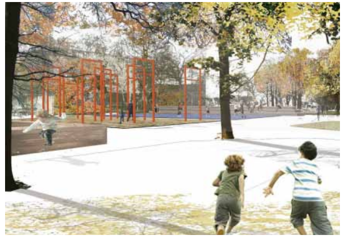
Visualisering af Bisgaard landskabsarkitekter ApS vinderforslag for Fælledparken