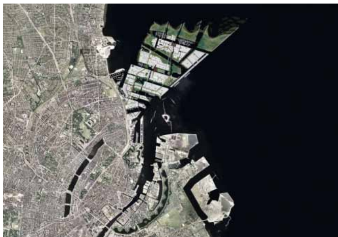
Nordhavn er det største udviklingsprojekt i Københavns Kommune