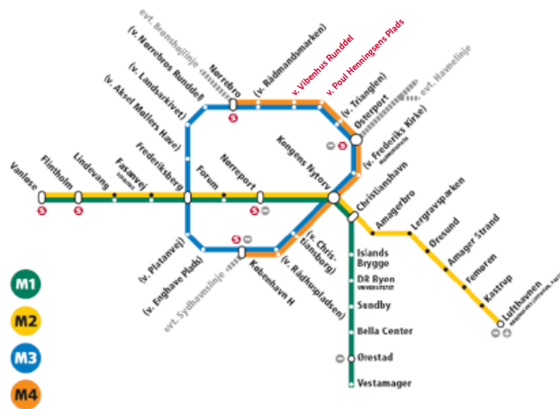
Med Cityringen kommer der to nye stationer i det nordlige Østerbro; Vibenshus Runddel og Poul Henningsens Plads.