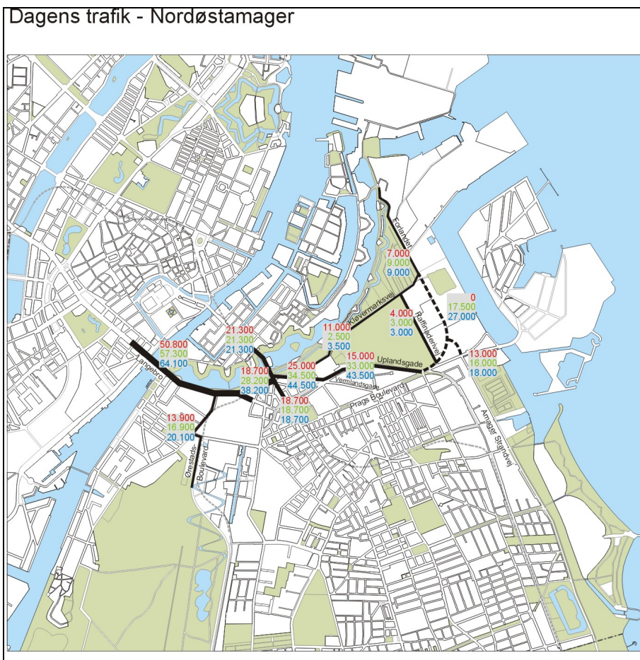
Figur 1. Dagens døgntrafik og forventet fremtidig døgntrafik som følge af byudviklingen beskrevet i tabel 1 og 2.

Den nye vejstruktur anbefales fremtidssikret med en 50 m. bred trafikkorridor fra Refshaleøen forbi Margretheholm og videre ad Forlandet og dennes forlængelse til Prags Boulevard. Denne korridor kan rumme en ny vejforbindelse til Refshaleøen (og til Nordhavnsområdet) samt busbaner eller en anden højklasset kollektiv trafikforbindelse. Et vejudlæg på 50 m. vil sikre, at det er muligt i fremtiden at etablere en fremtidig trafikkorridor i form af en nedgravet vejforbindelse.