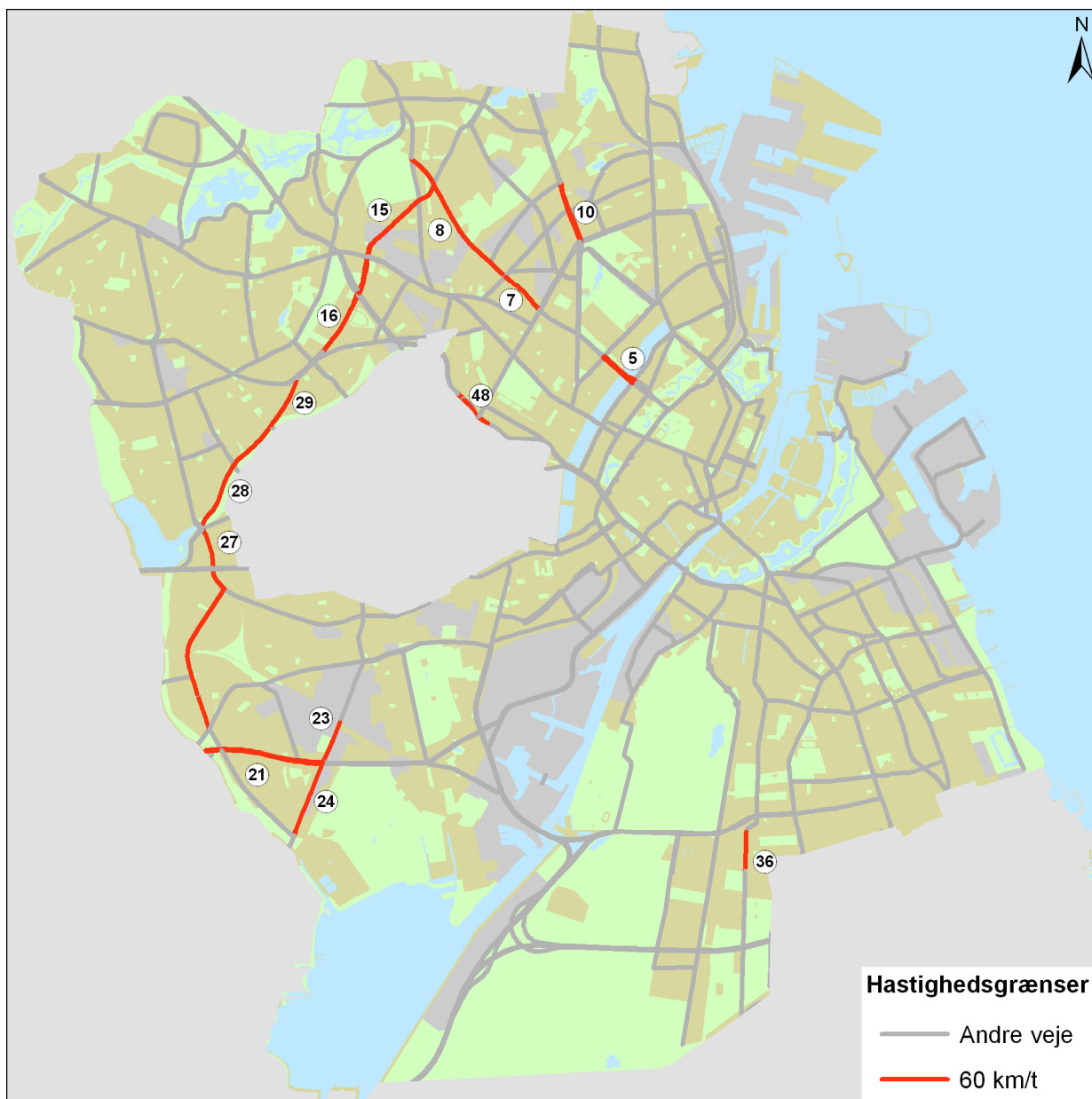
Figur 2: De 14 strækninger hvor hastighedsgrænsen foreslås nedsat til 50 km/t

På Vigerslevvej mellem Vigerslev Allé og Valby Langgade (uden nr.) er der allerede udarbejdet et projekt for etablering af hastighedsgrænse på 50 km/t. Dette projekt gennemføres under alle omstændigheder og er derfor ikke en del af denne hastighedsplan.