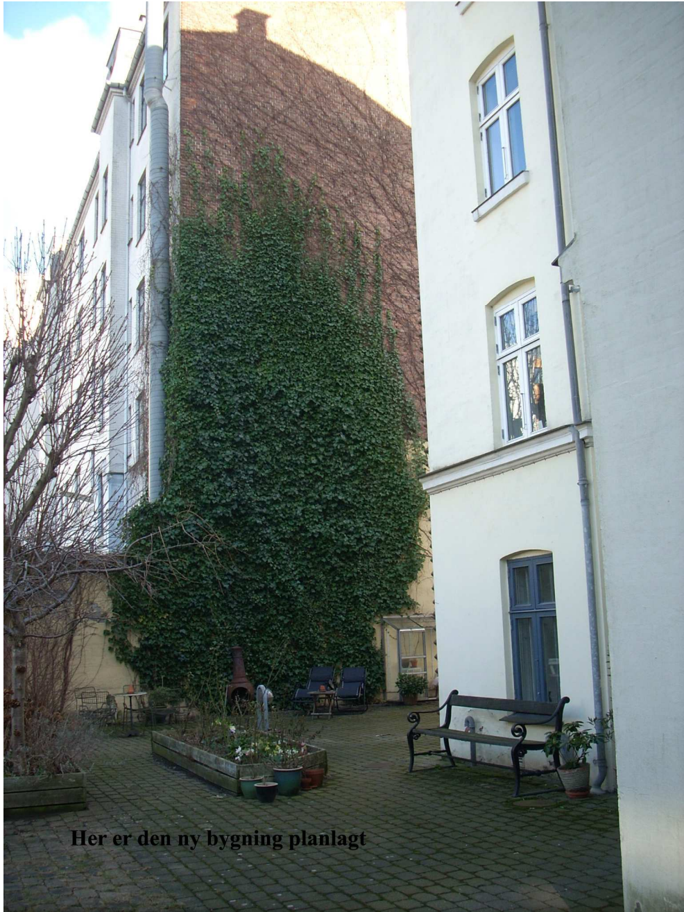
Her er den ny bygning planlagt