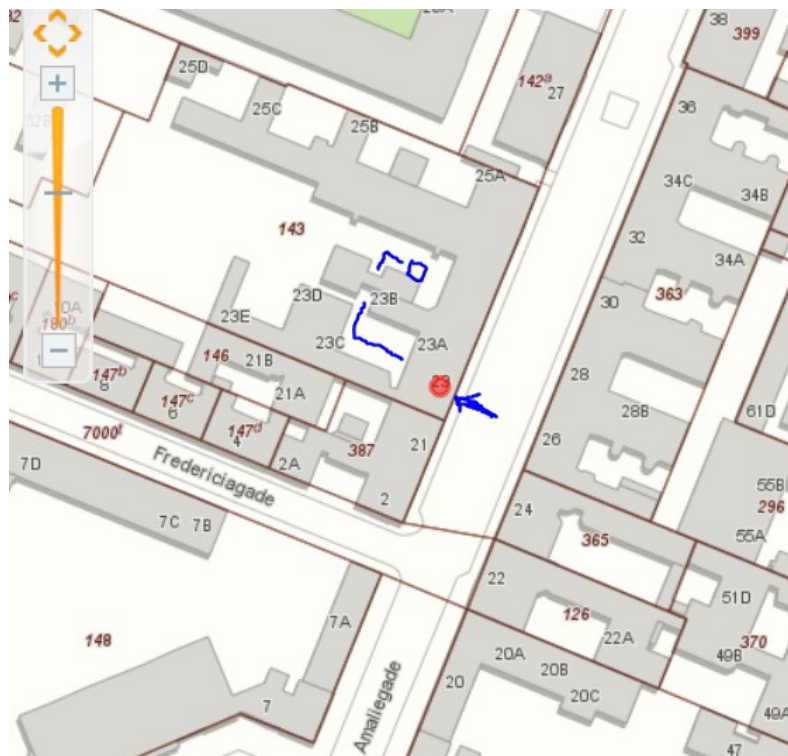
Figur 1 Affaldsskur i bagerste gård

Det eksisterende affaldsskur i den bagerste gård (se figur 1) er ikke stort nok til at rumme alle beholderne, og skal derfor udvides, hvis denne skal anvendes til den fremtidige affaldshåndtering. Hvis skuret bygges uden tag, kræves der ikke en byggetilladelse. Hvis der skal være tag på, kræver det en byggetilladelse, som forudsætter en forudgående tilladelse fra Slots- og Kulturstyrelsen.