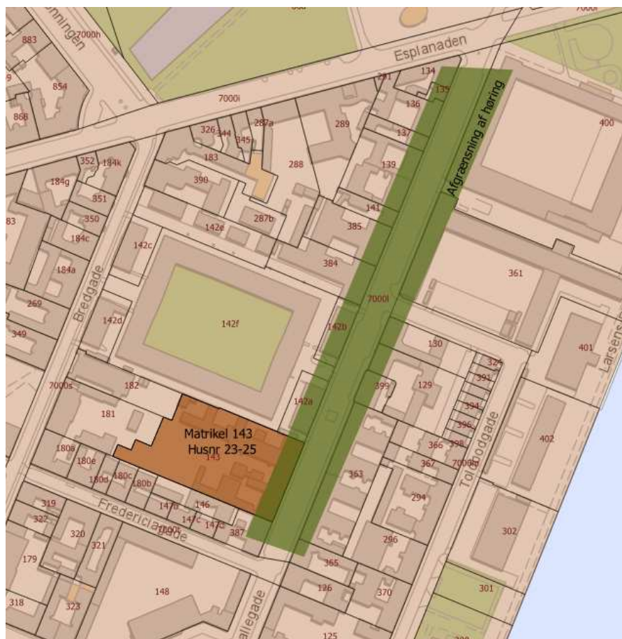
Figur 1 Afgrænsning af høring. Hovedejerne af alle de ejendomme, der berører den grønne markering, er blevet hørt. Den brune markering viser ansøgers ejendom

Forvaltningen har i høringsperioden modtaget 60 unikke henvendelser, som er samlet i bilag 9. 33 af henvendelserne er fra beboere i AB Amaliegade 26-36, som ligger overfor Amaliegade 23-25 (ansøger).