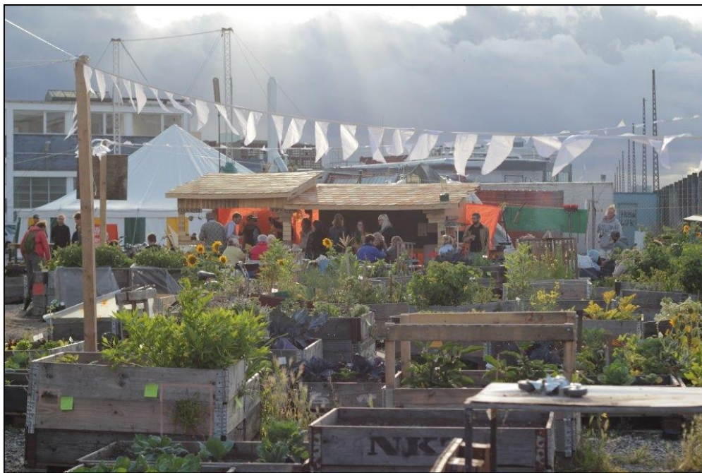
Prags Have på Prags Boulevard 43

Vi vil sikre muligheden for byhaver i lokale byrumsprojekter på gade- og gårdniveau, ved at fungere opsøgende og fagligt understøttende. Målgruppen er i særlig grad eksisterende organiseringer, som boligforeninger, borgergrupper og frivillige. Center for Park og Natur og lokale interessenter som Prags Have, Ørestad Urbane Haver, Metrohaverne, Projektbasen og boligforeninger er oplagte samarbejdspartnere.