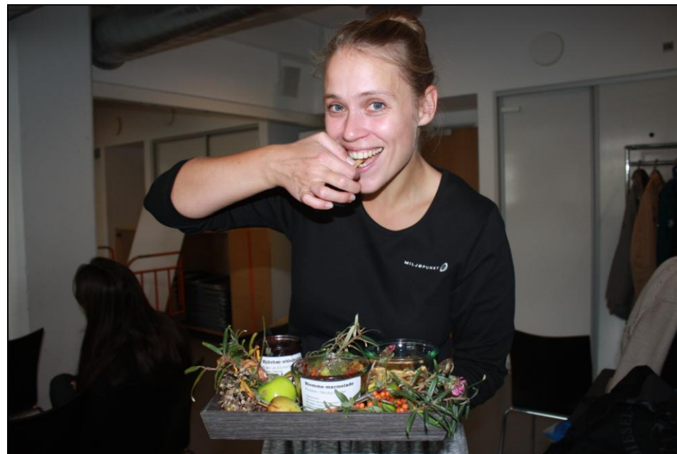
Smagsprøver fra foreningen Byhøst under konference Dyrk! Høst Spis!

Nogle af udviklingsprojekterne udvikles til fyrtårne, der i stigende grad også lyser ud over bydelenes grænser.