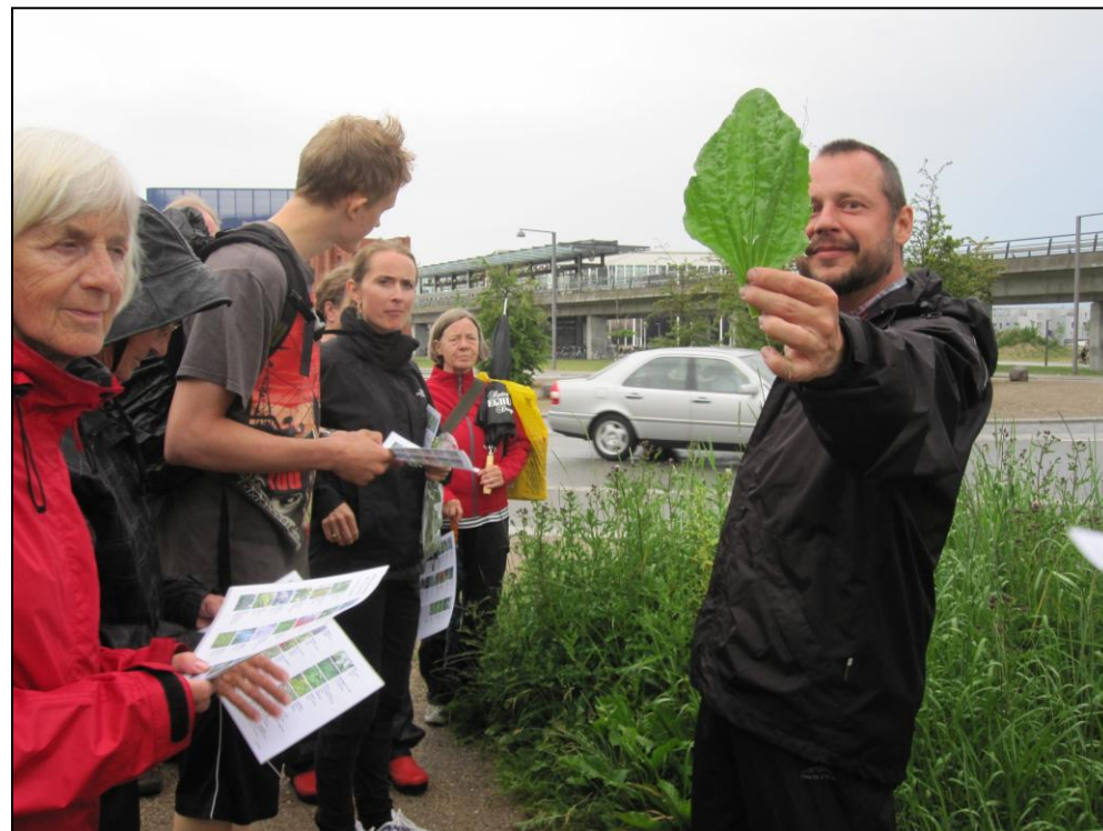
Tur til Spiselige planter på Amager Fælled

Målgruppen for denne indsats er borgere på Amager (Øst & Vest). For at nå dem, er det oplagt at samarbejde med Center for Park og Natur og lokale interessenter som Planteklubben, SGF og Projektbasen. Succeskriterierne for projektet er at afholde mindst to arrangementer eller ekskursioner i 2014.