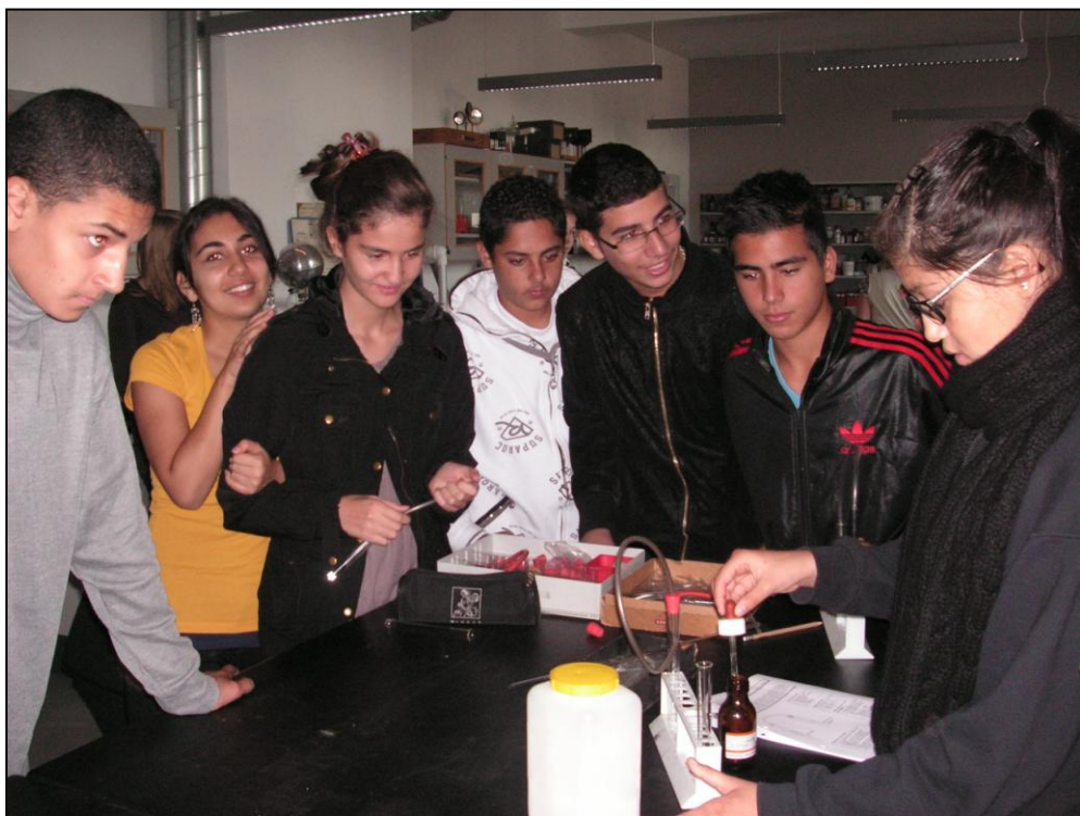
Klimakaravanen på Amager Fælled Skole

Målgruppen for indsatsen er lokale folkeskoler på Amager, herunder folkeskolelærerne, eleverne (i indskoling og mellemtrin) og forældrene. Samarbejdspartnere vil være folkeskoler på Amager hvor miljøambassadørerne har børn, Miljøtjenesten og Miljøstyrelsen.