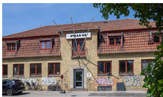
Prags Boulevard 61