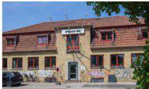
Prags Boulevard 61