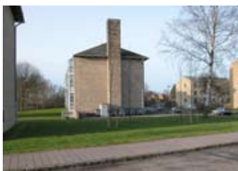
Gavlmotiv set fra Banefløjen mod vest.