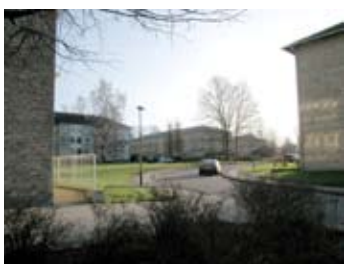
Kig fra Voldfløjen udmunding i Åfløjen set mod sydøst.

Lokalplanområdet er vist med rød punkteret streg.