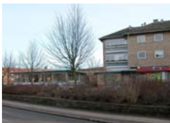
Butikstovet mod Frederikssundsvej.

De 2 blokke i 3 etager i afdeling 12 (områdets nordøstlige del) er opført i 1980'erne og fremstår i deres arkitektoniske udtryk meget anderledes end øv-