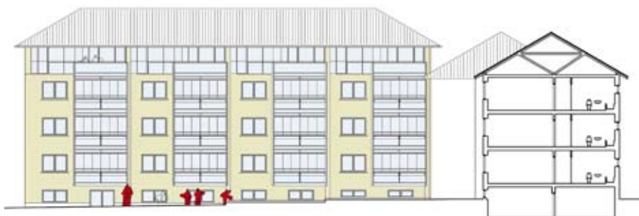
Projekt med den nye tagetage set fra haveside samt tværsnit i eksisterende blok med 3 etager.

rige blokke indenfor lokalplanområdet. De findes af hensyn til deres arkitektur ikke velegnede til påbygning af en tagetage. De 2 blokkes øvrige forhold reguleres dog i lokalplanen.