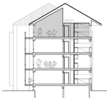
Tværsnit af projekt med den nye tagetage (vist med grå farve).