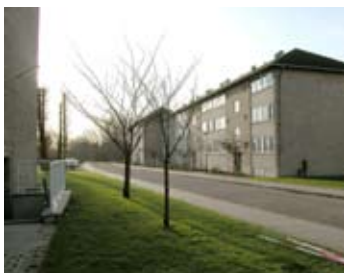
Blok langs Banefløjen set mod syd.