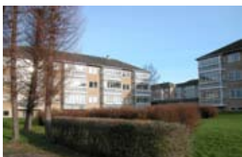
Eksempel på de inddækkede altaner mod haveside - udført i 90'erne.