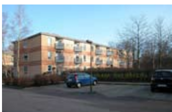
En af de to blokke, der udgør afd. 12.