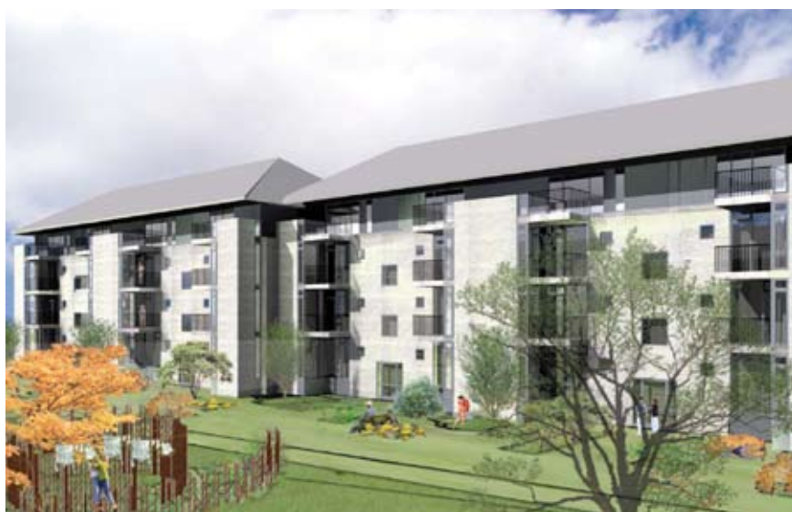
Projekt med den nye tagetage set fra adgangsside.