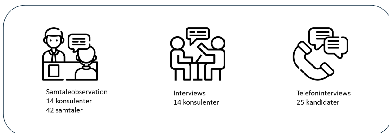
FIGUR 1.1.: METODER I UNDERSØGELSEN

Undersøgelsen af samtalerne bygger på et kvalitativt undersøgelsesdesign, der primært består af samtaleobservation, interviews med konsulenter og telefoninterviews med kandidater. Derudover vil vi løbende trække på tidligere desk research.