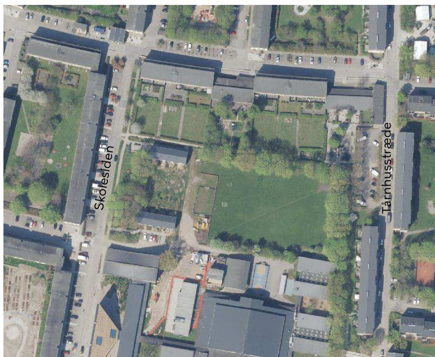
Eksisterende forhold nord for Tingbjerg Skole