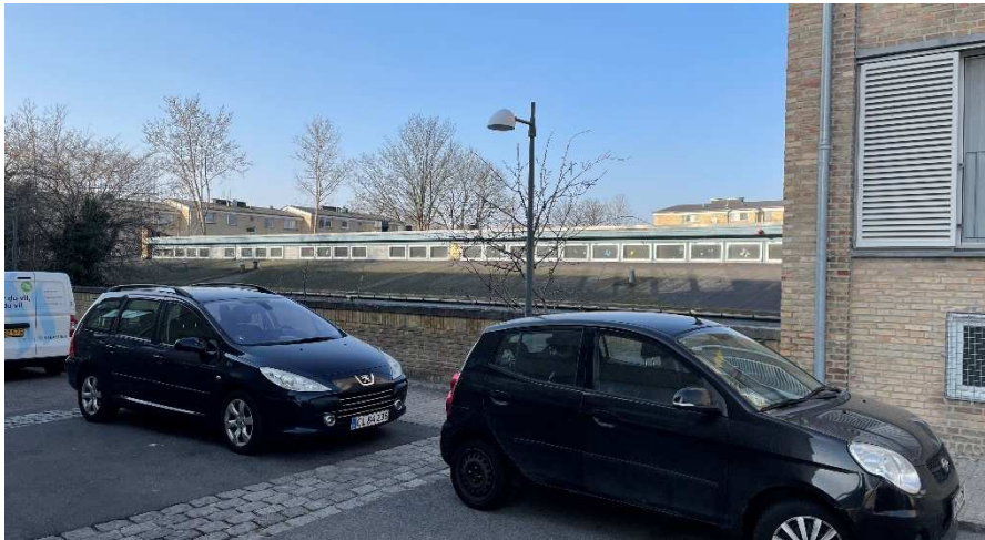
Mod øst ligger bygningen sænket og tilbagetrukket i forhold til gaden