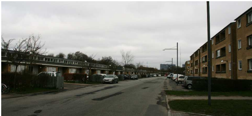
Rækkehuset set fra syd langs Langhusvej

Bygningen er i sig selv en flot og markant bebyggelse, men adskiller sig i bygningsform, og i placeringen i den vestlig udkant på den anden side af en bred vej fra den øvrige bebyggelse, så den forekommer ikke at være helt så integreret i bebyggelsen, og samtidig med at den afgrænser bebyggelsen spærrer den delvis også for udsyn og adgang til bagvedliggende grønne områder, hvortil der kun er adgang via et par gennemgange.