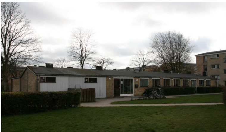
Den fritliggende fløj set fra nord