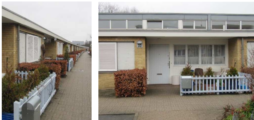
De enkelte boliger er markeret af tilbagetrukne indgangspartier