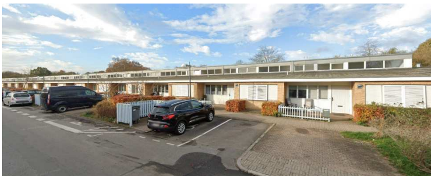
Udsnit af rækkehusets nordlige østfacade