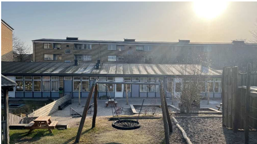
Bygningens vestfacade med den karakteristiske facadebeklædning og højformater.

Bygningen ligger lidt tilbagetrukket fra Bygårdsstræde på et lavere terræn hvor niveauforskellen markeres af en lav mur i gadeflugt, så bygningen markerer sig sænket og mindre synligt i gadebilledet, mens bygningen er i niveau med det grønne areal mod vest.