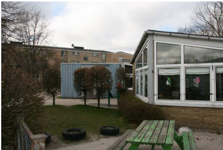
En af de mange formede udbygninger på den nordlige tværfløj