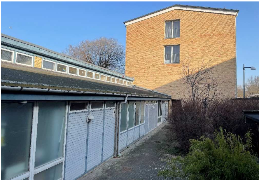
Østfacaden er ligeledes præget af elementer i højformat.