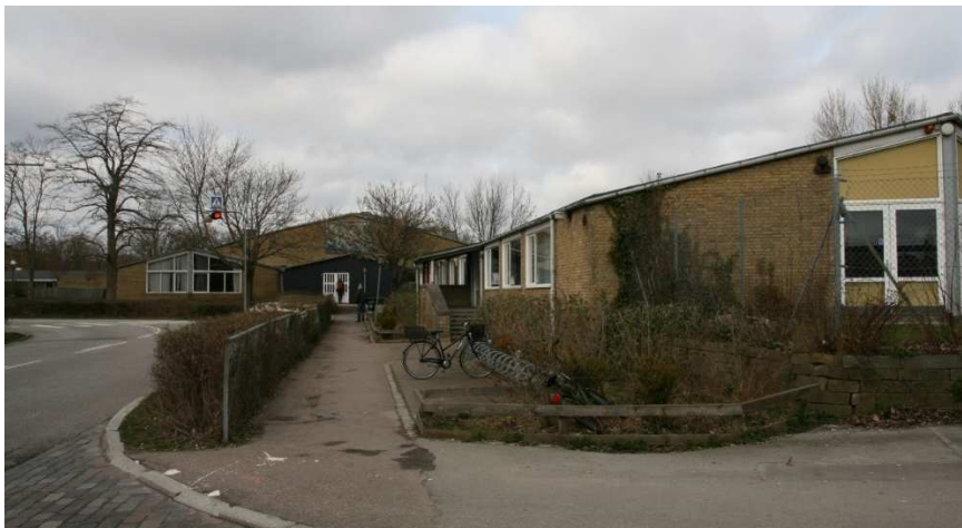
Bygningsanlægget set fra syd Terrasserne med gavlenderne af de to hovedfløje.

Med sin materialitet og tidstypiske arkitektur indskrives bygningerne sig i bebyggelsens helhed samtidig med at de skiller sig ud ved en skala i 1 etage og et lidt anderledes formsprog. Den langstrakte form gør at det samlede bygningsanlæg er lidt svært at få et samlet overblik på stedet, og sammen med den yderlige placering gør det at anlægget ikke opleves som helt så integreret i bebyggelsen som mange andre af bygningerne.