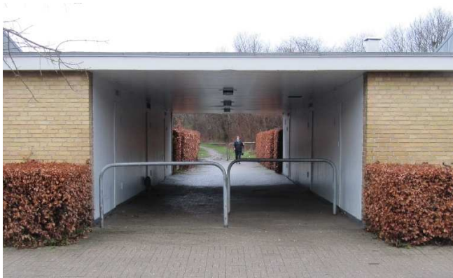
En af de to gennemgange fra Langhusvej til de grønne arealer