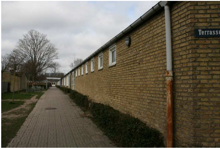
Den lange vestfacade af den vestlige af de to hovedfløje