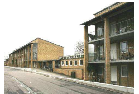
Arkaderne mod øst med en 1-etages institution

Tingbjerg er opført på grundlag af en bebyggelsesplan udarbejdet i 1950 af Arkitekt Steen Eiler Rasmussen i samarbejde med havearkitekt C. Th. Sørensen. I 1956 påbegyndtes byggeriet og størstedelen af bebyggelsen var færdigopført i 1970. I 2018 er der opført et kulturhus tegnet af arkitektfirmaet COBE. Bygården mod Ruten stod i medio 2020 færdigbygget med butikker og private boliger på det førhenværende Lille Torv.