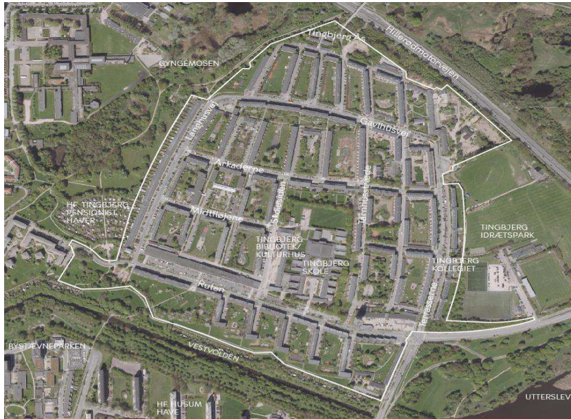
Luftfoto af Tingbjerg med lokalplanafgrænsningen markeret med hvidt.

Vejbetjening sker med et net af veje, der via et ringvejssystem (Ruten-Terrasserne-Gavlhusvej-Langhusvej) er koblet til det overordnede vejnet. For at undgå en monoton bydel har Steen Eiler Rasmussen søgt at gøre vejene så karakterfulde som muligt. Dette er løst ved at differentiere gadenettet, så hver vej og gade er udformet efter sin specielle placering og funktion inden for området, og ved at vejene krummer.