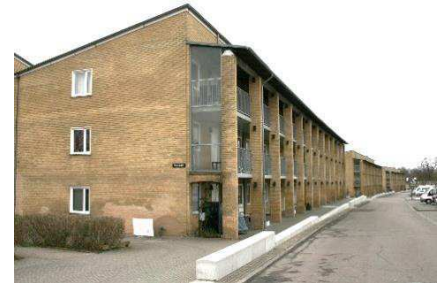
Arkadernes kurvede forløb set mod vest