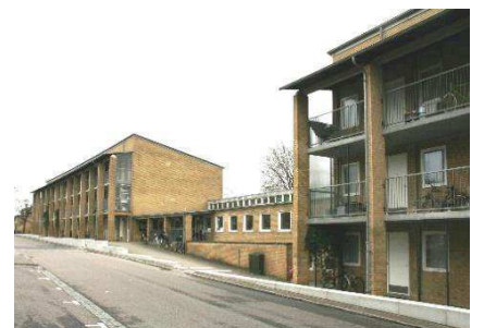
Arkaderne mod øst med en 1-etages institution

Tingbjerg er opført på grundlag af en bebyggelsesplan udarbejdet i 1950 af Arkitekt Steen Eiler Rasmussen i samarbejde med havearkitekt C. Th. Sørensen. I 1956 påbegyndtes byggeriet og størstedelen af bebyggelsen var færdigopført i 1970. I 2018 er der opført et kulturhus tegnet af arkitektfirmaet COBE. Bygården mod Ruten stod i medio 2020 færdigbygget med butikker og private boliger på det førhenværende Lille Torv.