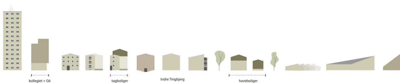
Diagrammatisk visning af eksisterende og kommende bygningshøjder i Tingbjerg, dog er etageboliger mod nord muligvis i lokalplan 609 ikke vist. Illustration: Vandkunsten