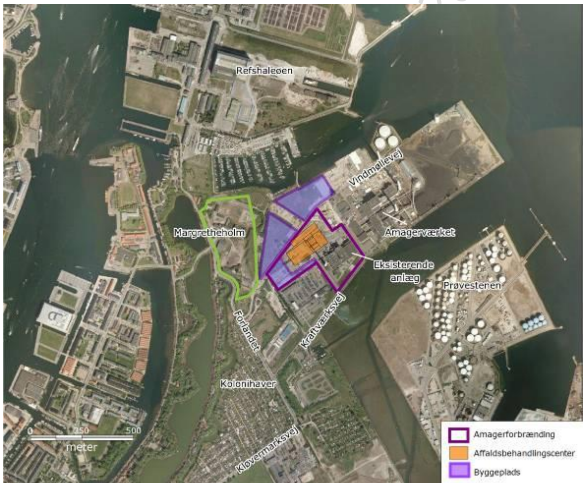
Figur 1-1 Amagerforbrændings nye affaldsbehandlingscenter, byggeplads samt omgivelser.

Affaldsforbrændingsanlægget etableres i perioden 2012-2016, mens sorteringsanlægget først forventes etableret i 2018. I takt med at det nye affaldsforbrændingsanlæg sættes i drift, vil driften af det eksisterende anlæg blive udfaset og den eksisterende bygning blive revet ned. Amagerforbrænding ønsker ligeledes at bygge et demonstrationsanlæg til raffinering af husholdningsaffald (benævnt REnescience) i den eksisterende bygning. Demonstrationsanlægget forventes at skulle være i drift i perioden 2013 til nedtagning af den eksisterende bygning. Et kommercielt REnescienceanlæg kunne komme til at indgå som et element i sorteringsanlægget, hvorfor dette i VVM-redegørelsen også er medtaget i virkningerne på miljøet af sorteringsanlæggets driftsfase.