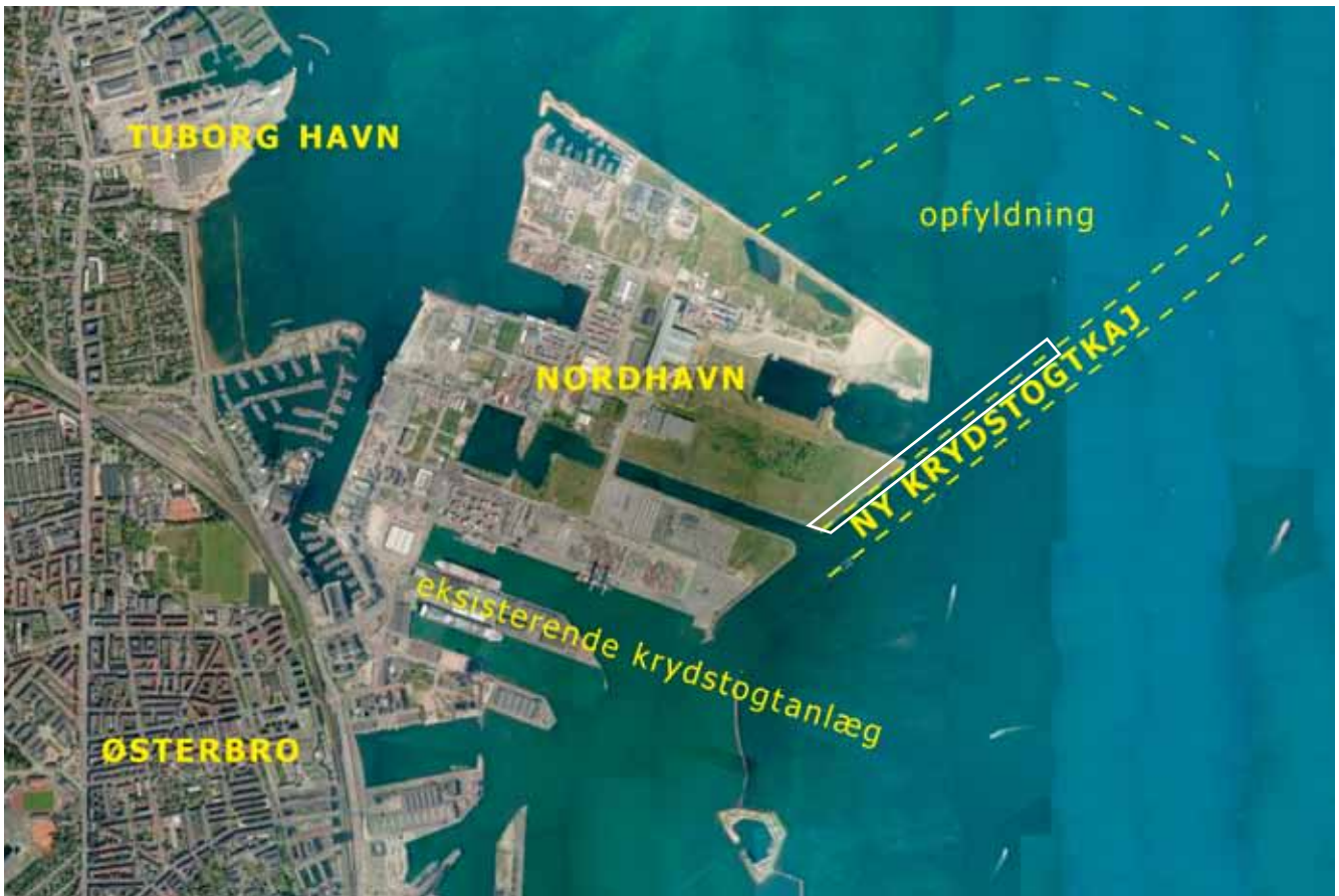
Lodfoto, der viser sammenhængen mellem Nordhavn, Østerbro og Tuborg Havn. Det aktuelle lokalplantillægsområde er vist med hvidt.