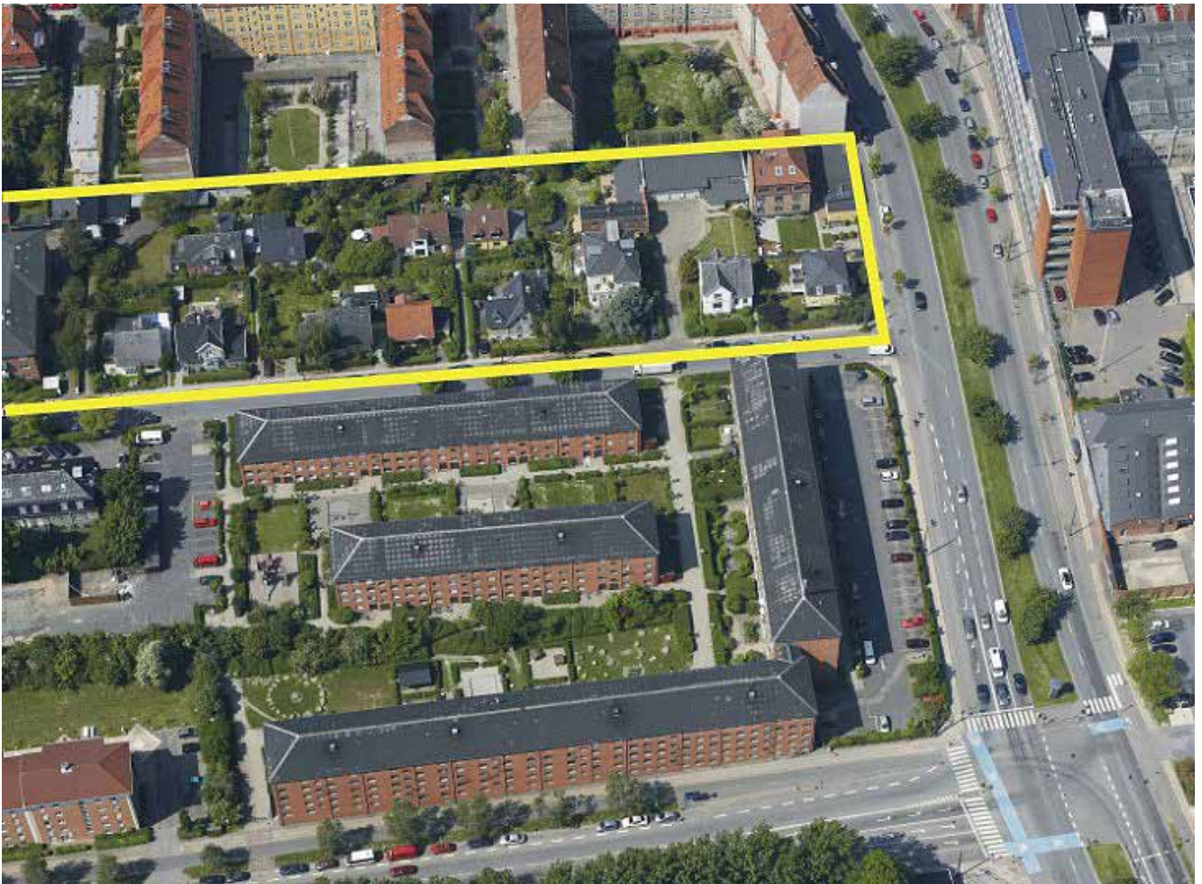
Den nordlige del af lokalplanområdet vist med gul indramning. Denne del er præget af villabebyggelse omgivet af etageboliger. Mod nord grænser området til Vigerslev Allé.