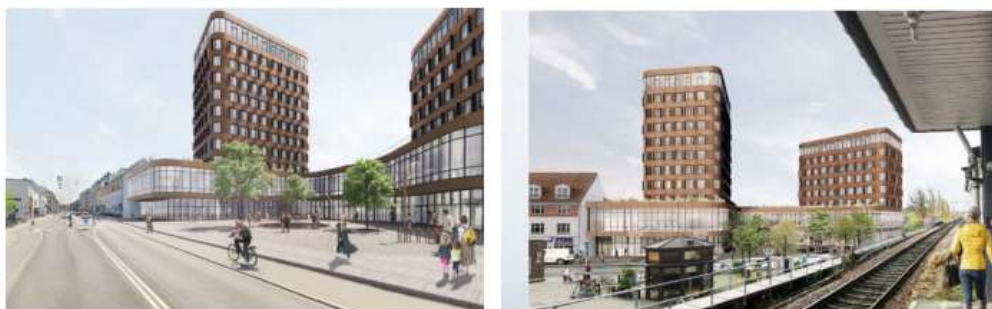
Figur 1 viser visualisering af projektet med et en basehøjde på mellem 12-15 meter og 2 smallere tårne på henholdsvis 30 og 40 meter.

parkeringskælder på 4000 m 3 . Eksisterende forhold fremgår af figur 2, pt. fremstår grunden, som et ubebygget areal, hvor der tidligere har været forskellig erhvervsaktiviteter og derfor er jorden forurennet.