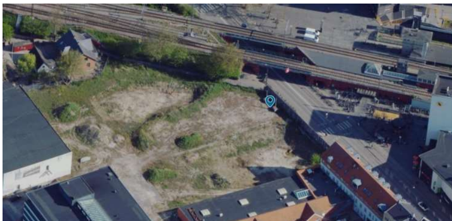
Figur 2 viser de eksisterende forhold af projektområdet (2023 luftfoto). Arealet på den ubebyggede grund på ca. 5500 m 2 .

I kælderniveau etableres parkering, som vil være tilgængelig for brugere af bygningen. Tilkørsel til parkeringskælderen sker fra Julie Arenholts Vænge. Der etableres 200 parkeringspladser i kælderen under projekt (Tårnhusene). Det er en del af projektet at der etableres ca. 500 nye cykel p-pladser.