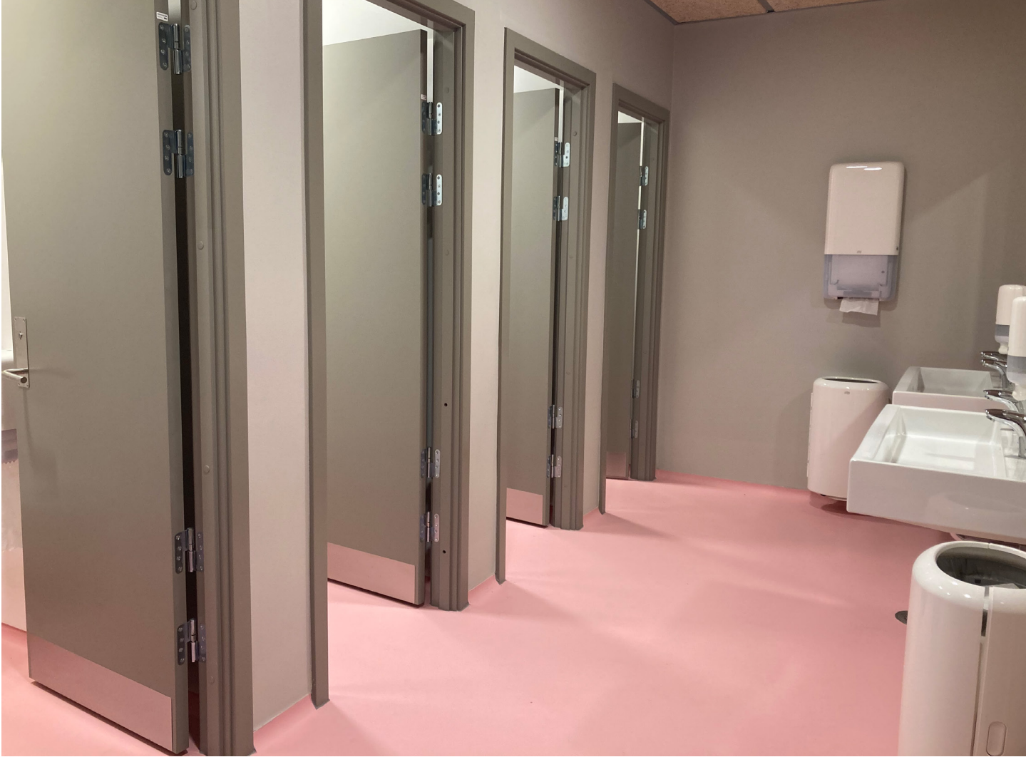
Stort forrum indrettet med håndvaske og med 4 toiletrum på stribе.

Skolernes toiletter bliver brugt af mange elever i løbet af dagen. Derfor er det vigtigt, at toiletterne er placeret tæt på elevernes primære opholdsområder, så alle elever kan nå at komme på toilettet, når de har behov for det. Der til kan toiletter med forrum skabe et godt flow af elever, så tiden på toilettet optimeres.