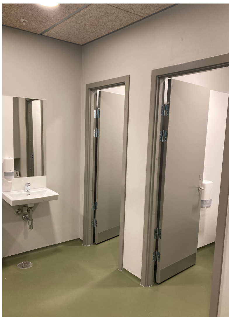
Et eksempel på et godt oplyst forrum i farver.