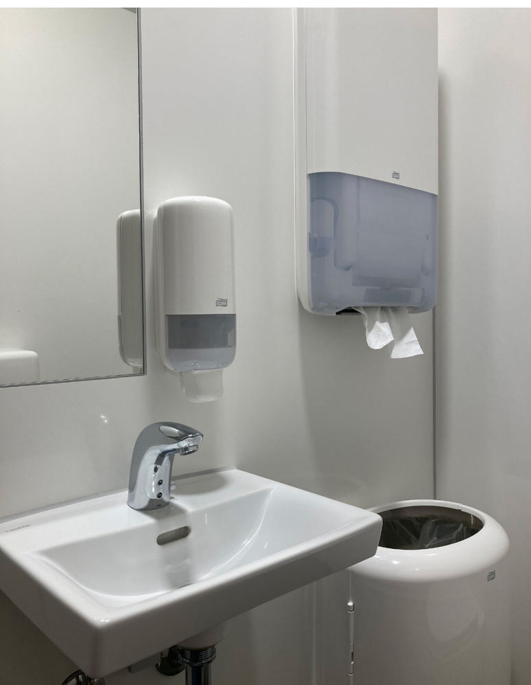
Spejl er smallere end håndvaskens bredde. På den måde sikres korrekt placering af sæbedispenser.

Toilettets inventar skal placeres hensigtsmæssigt med tanke på optimal adfærd og brug. Det gælder om at dryppe mindst muligt på gulvet efter at have vasket hænder, så oplevelsen af renhed sikres bedst muligt. Dertil skal inventar så vidt muligt væghænges, da det letter den daglige rengøring.