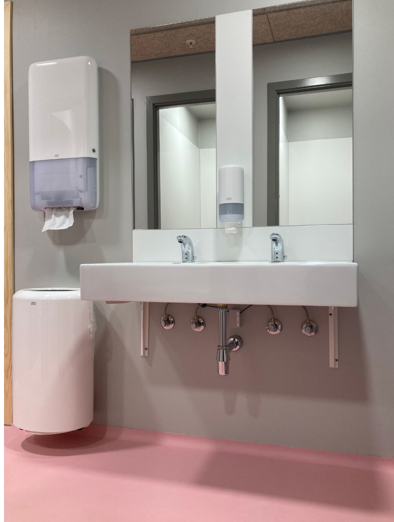
Her ses korrekt placering af inventar. Sæbedispenseren er placeret over vasken. Papirhåndklæder er placeret tæt ved vasken og over skraldespanden.