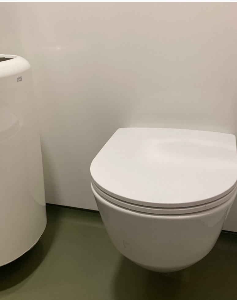
Et væghængt toilet minimerer rengøringsflader og rengøring af gulvet lettes.

Toilettets tekniske installationer bør udvælges med fokus på kvalitet, robusthed og med hensyn til teknisk drift. Rørføringer og tekniske installationer etableres så vidt muligt skjult, så ansamling af snavs og støv reduceres. I målet om let rengøring skal teknikken dog ikke skjules i en grad, som forhindrer gode vilkår for den tekniske drift.