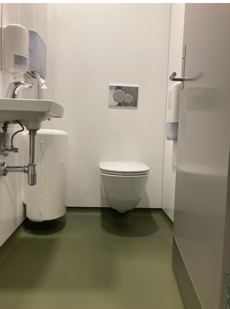
Gulvbelægning med afsluttet gulv med hulkele. Toilettet og øvrigt inventar er væghængt for også at lette rengøringen

Toiletrummetts vægge, gulve, lofter, døre og låse har stor betydning for elevernes oplevelse af deres toiletbesøg. En god oplevelse af rummet kan være med til at mindske de mentale barrierer, der kan være forbundet med toiletbesøg. Farver og god belysning kan dertil forbedre brugeroplevelsen og understøtte hensigtsmæssig adfærd hos eleverne. Materialer og overflader bør samtidigt vælges med tanke på rengøring og robusthed.