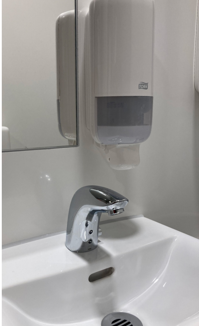
Håndfrie vandhaner optimerer hygiejneforhold og letter rengøringen.