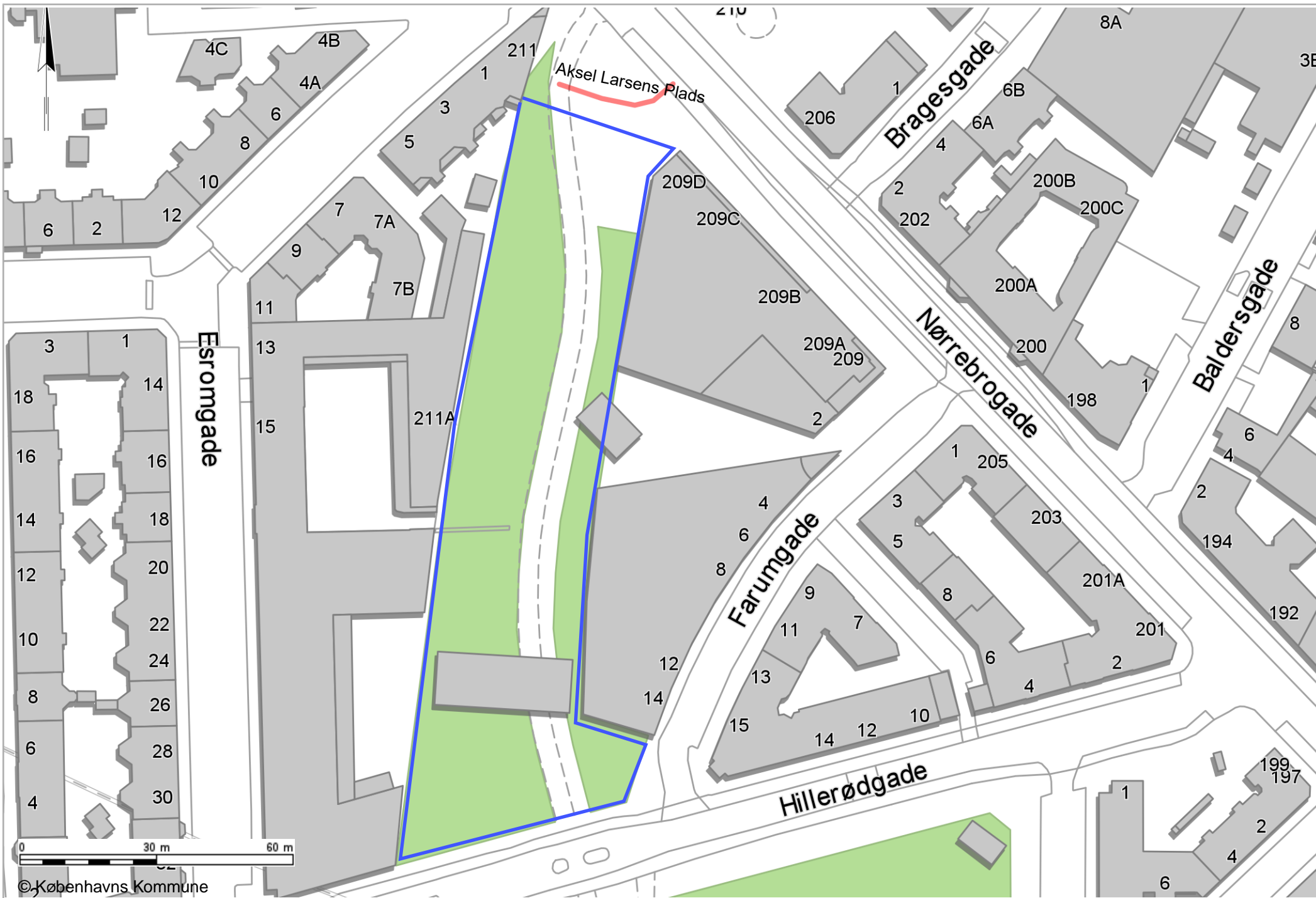
Bilag 2: Kort med grønt område der kan navngives - er markeret med blå.