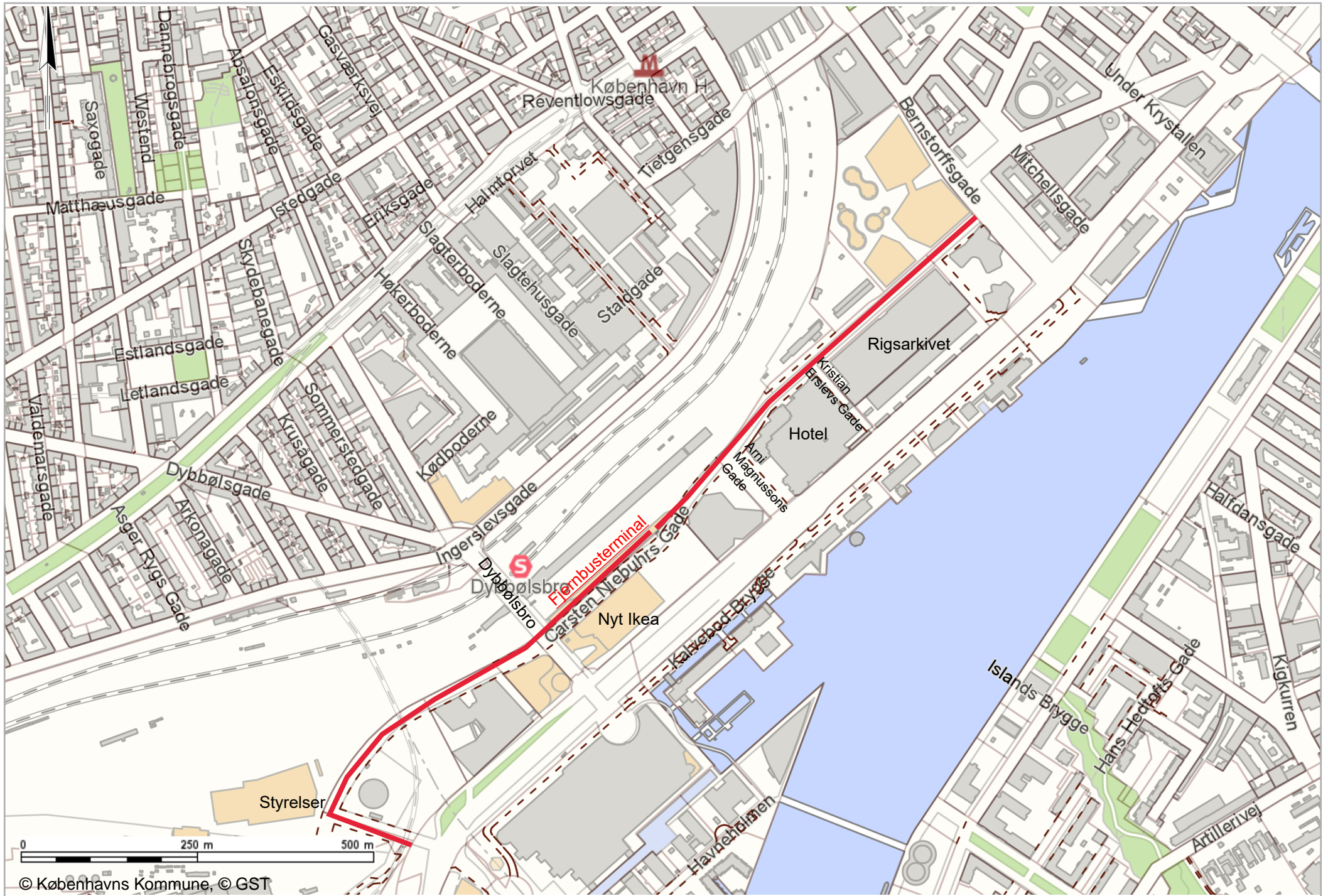
Bilag 2 Området med fjernbusterminal og Carsten Nieburs Gade (med rødt).