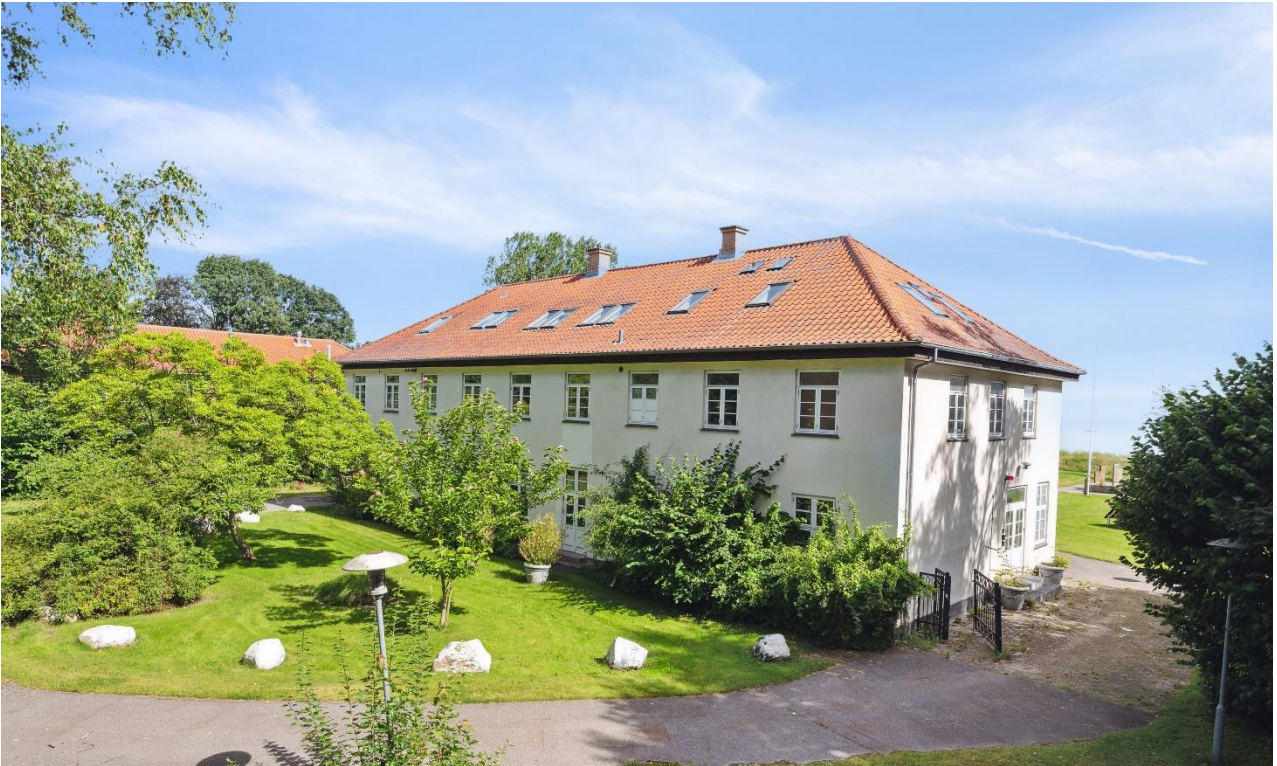
Ejendommens udsigt til Øresund