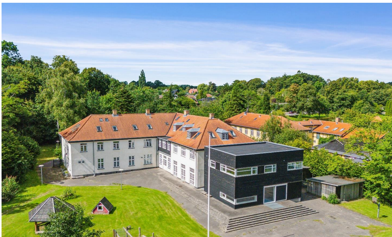
Ejendommen set fra Øresund - dronefoto

Nærværende bestemmelse tinglyses servitutstiftende forud for al pantegæld. Københavns Kommune, Økonomiforvaltningen, er påtaleberettiget.