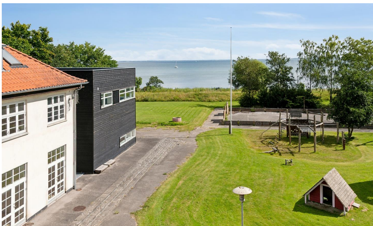
Tagetagens udsigt til Øresund

Der er ikke indhentet tilstandsrapport og huseftersyn tilbydes ikke.