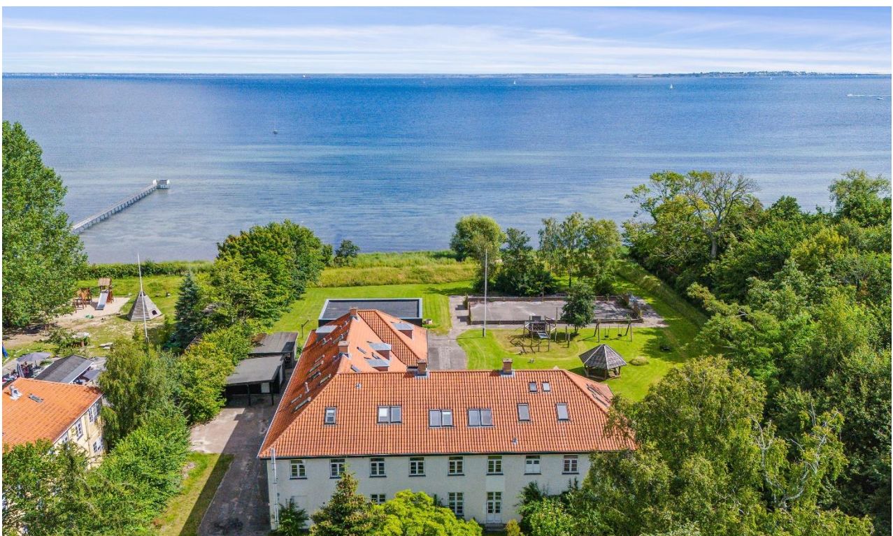
Ejendommen - dronefoto

Ejendommen har været selvforsikret i sælgers ejertid. Det er købers eget ansvar at tegne lovpåkligtede forsikringer senest på overtagelsesdagen.