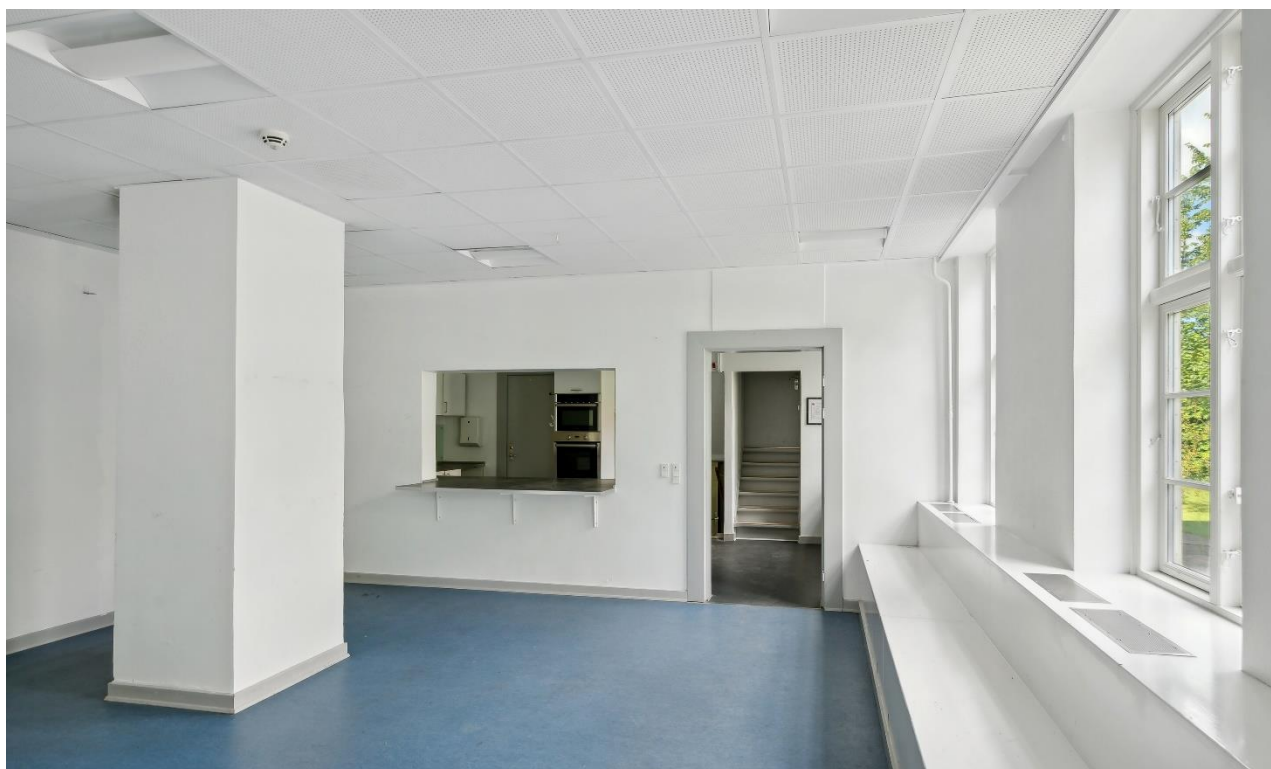
Stueplan - køkken