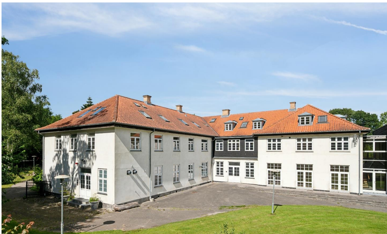
Ejendommen set fra haven