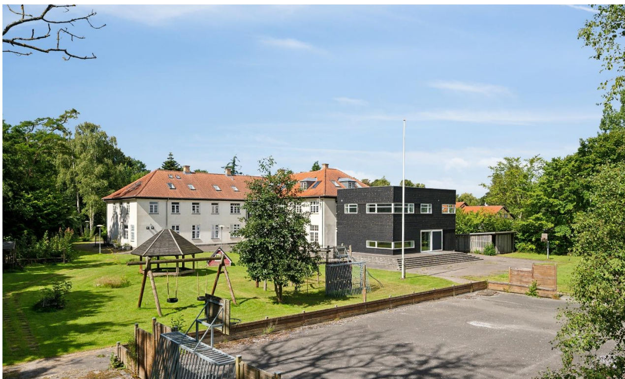
Ejendommen set fra haven - dronfoto

Såfremt der på ejendommen opføres og/eller indrettes bebyggelse med et bruttoetageareal efter byggelovgivningen på mere end 2.237,1 m 2 , eller såfremt ejendommen skifter anvendelse i forhold til den ved salget tilladte anvendelse til åben-lav boligbebyggelse, større rekreativt område, område til offentlige formål, jf.