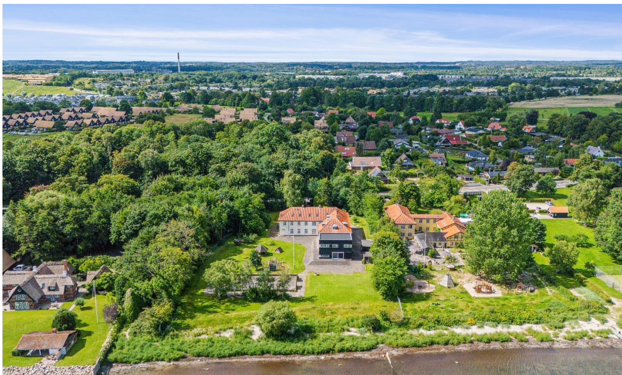
Ejendommen set fra Øresund - dronefoto