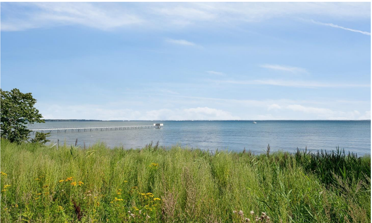
Havens udsigt til Øresund og Nivå Bugt