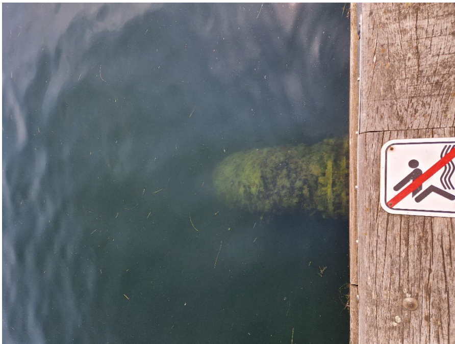
Billede 2: HOFORs overløbsledning

Svaret er offentligt tilgængeligt på https://www.kk.dk/politik/politiske-udvalg/teknik-og-miljoeudvalget/politikerspoeergsmaal-til-teknik-og-miljoeforvaltningen